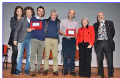
Il cast di Basta poco