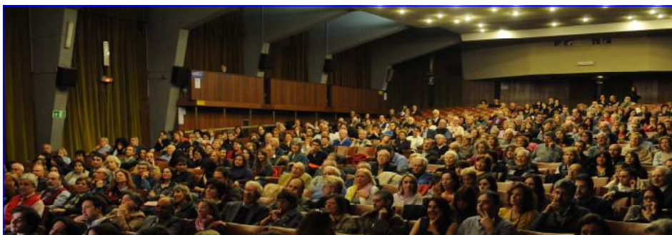
Il nostro pubblico

Il Cinecircolo Romano è un'associazione culturale cinematografica senza fine di lucro, giuridicamente riconosciuta e aderente al Centro Studi Cinematografici, che è giunta al suo 50° anno di attività e conta circa 2.000 soci che ne fanno il cineclub più consistente d'Italia. L'associazione presenta ogni anno 40 film selezionati per qualità tra i più recenti disponibili sul mercato distributivo. Da ottobre a maggio il programma annuale prevede 200 proiezioni di film con circa 100.000 presenze di spettatori, accolti nella sala di proiezione dell'Auditorium San Leone Magno di Roma, in Via Bolzano 38, una delle più grandi della capitale. Prologo prima di ogni film, dibattiti a fine ciclo, settimana culturale a tema, progetto di educazione al cinema d'autore per le scuole, attività culturali collaterali quali teatri, concerti, seminari di cultura cinematografica, mostra-concorso di arti figurative, concorso di cortometraggio nonché l'edizione della Rivista "Qui Cinema", sono importanti corollari delle attività di promozione culturale cinematografica dell'Associazione.