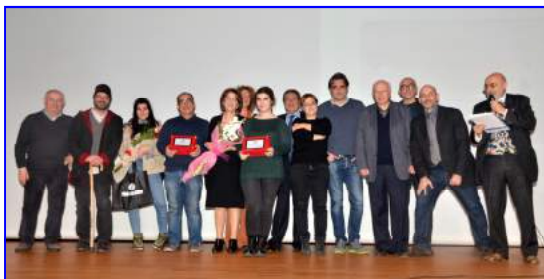
I premiati sul palco