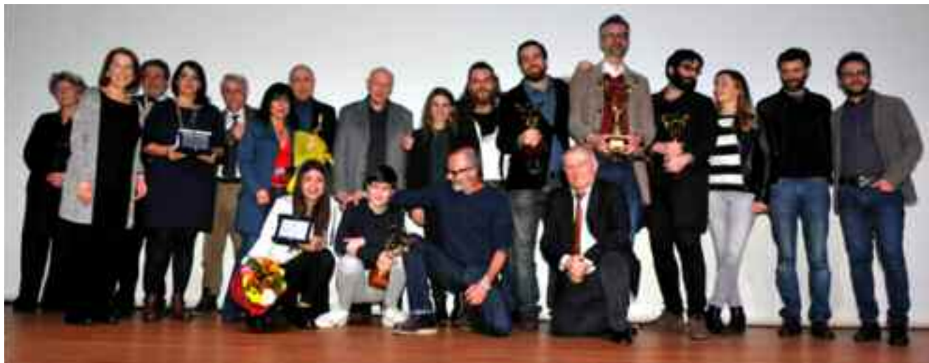
Foto di gruppo della XIII edizione sul palco dell'Auditorium San Leone Magno