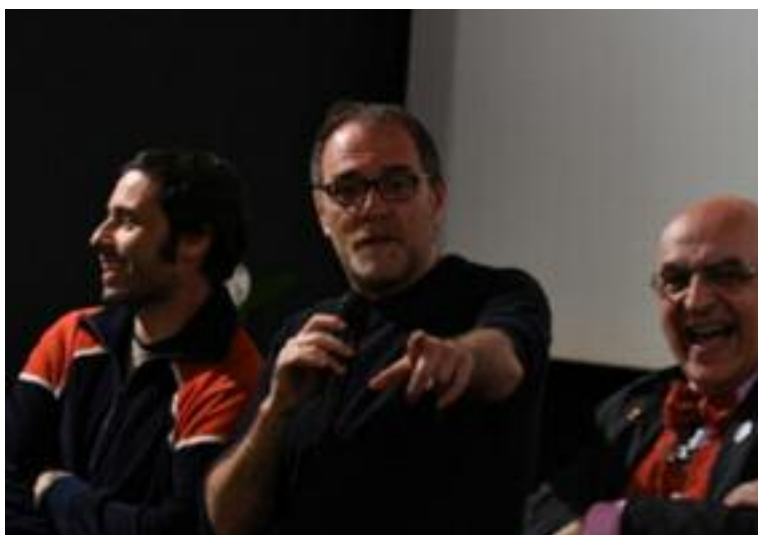
Valerio Mastandrea durante l'incontro con gli studenti