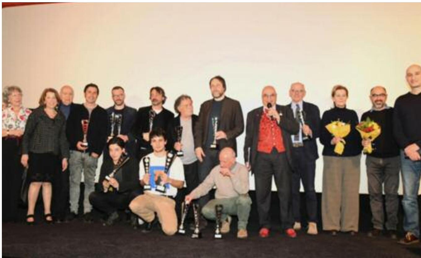
I protagonisti della XV edizione del Premio Cinema Giovane & Festival delle Opere Prime sul palco del Cinema Caravaggio per un foto ricordo.