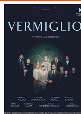
ORE 21.00 CERIMONIA DI PREMIAZIONE e a seguire VERMIGLIO di Maura Delpero (2024 - 127')